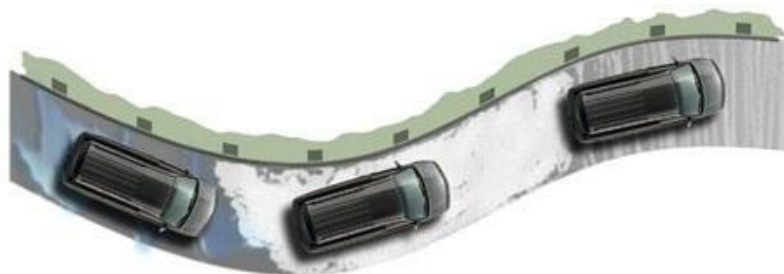
Con control de tracción.

Nota: la desactivación del control de tracción no deshabilita o afecta al funcionamiento del sistema ABS. La mayoría de los sistemas de control de tracción sólo operan a velocidades inferiores a 50 kph, porque por lo general no es necesario a altas velocidades. Además, el frenado a altas velocidades puede tener un efecto adverso sobre el manejo del vehículo y la estabilidad, a menos que el control de tracción también sea parte de un sistema de control de estabilidad total, que supervisa la estabilidad del vehículo y el manejo en todas las velocidades.