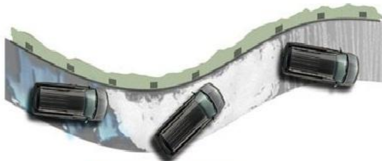
Sin control de tracción.

No confundir con control de estabilidad.